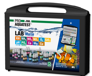
JBL PROAQUATEST LAB Marin Professioneller Testkoffer zur Meerwasser-Analyse