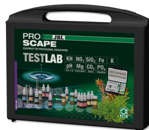
JBL PROAQUATEST LAB PROSCAPE Testkoffer zur Wasseranalyse in Pflanzenaquarien