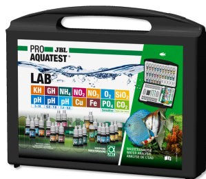
JBL PROAQUATEST LAB Testkoffer mit 13 Wassertests zur Süßwasser-Analyse