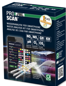
JBL PROSCAN Wassertest mit Smartphoneauswertung