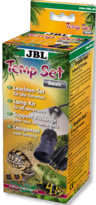
JBL TempSet basic Installationsset für Terrarien- Strahler