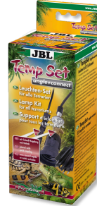
JBL TempSet angle+ connect Installationsset für Terrarien- Strahler