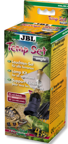
JBL TempSet angle Installationsset für Terrarien- Strahler