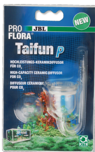
JBL PROFLORA Taifun P Mini-CO2-Diffusor für Nano- Süßwasser-Aquarien