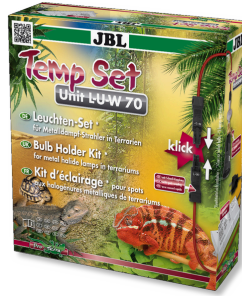
JBL TempSet Unit L-U-W Installationsset für Metalldampfstrahler (LUW und HQI)