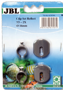
JBL SOLAR REFLECT Clip Set Halterung für Leuchtstoffröhren