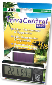
JBL TerraControl Solar Solar-Thermometer und Hygrometer für alle Terrarien