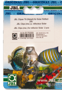
JBL Clipse T5/T8 Metall Metallhalterung für Leuchtstoffröhren