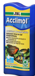
JBL Acclimol Wasseraufbereiter zur Neueingewöhnung