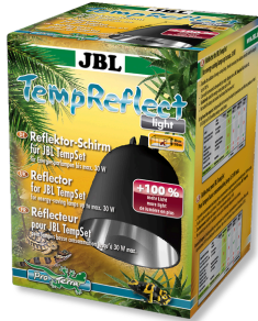
JBL TempReflect light Reflektor-Schirm für Energiesparlampen