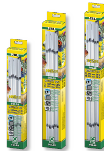
JBL SOLAR Reflect T5/ T8 - 895-1500 mm Reflektorblech für Solar- Leuchtstoffröhre