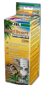
JBL ReptilDesert UV Light Energiesparlampe für Wüstenterrarien