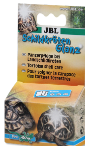
JBL Schildkrötenglanz Panzerpflege für Landschildkröten