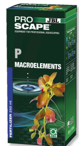
JBL PROSCAPE P MACROELEMENTS Phosphor-Pflanzendünger für Aquascaping