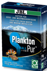
JBL PlanktonPur SMALL Leckerbissen für kleine Aquarienfische