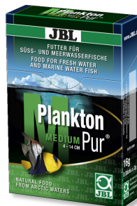
JBL PlanktonPur MEDIUM Leckerbissen für große Aquarienfische