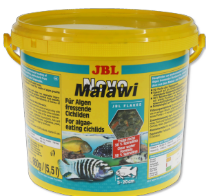
JBL NovoMalawi Hauptfutterflocken für algenfressende Buntbarsche