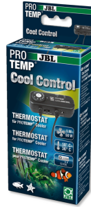
JBL PROTEMP CoolControl