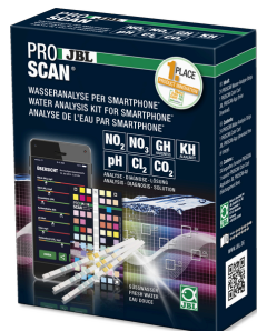
JBL PROSCAN Test para el agua con evaluación por smartphone