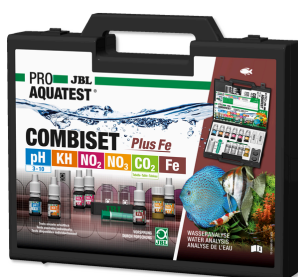
JBL PROAQUATEST COMBISET Plus Fe Maletín con los test más importantes + test de hierro