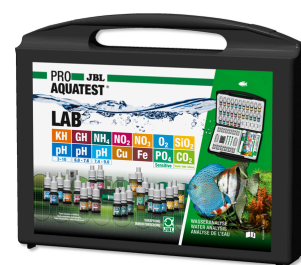
JBL PROAQUATEST LAB Maletín con 13 test para analizar el agua dulce