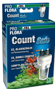
JBL PROFLORA CO 2 Count Safe Contador de burbujas con válvula de retención