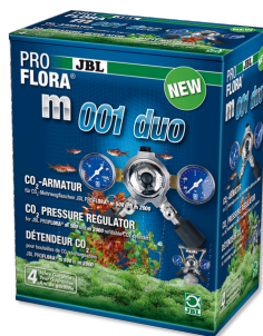
JBL PROFLORA m001 duo Válvula para regular presión, para 2 difusores de CO 2