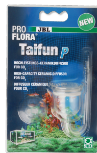
JBL PROFLORA Taifun P Minidifusor de CO2 para nano acuarios de agua dulce