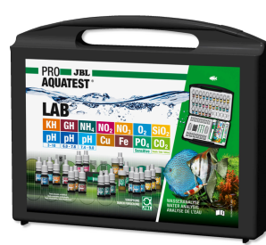
JBL PROAQUATEST LAB Maletín con 13 test para analizar el agua dulce