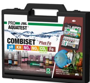
JBL PROAQUATEST COMBISET Plus Fe Maletín con los test más importantes + test de hierro