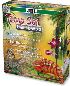
JBL TempSet Unit L-U-W Kit instalación lámparas de vapor metálico (LUW/HQI)