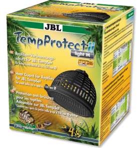
JBL TempProtect II light Protector contra quemaduras reptiles para JBL TempSet