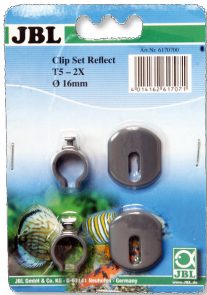
JBL SOLAR REFLECT Set clips Soporte para tubos fluorescentes