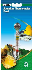
JBL Termómetro flotante para acuarios Termómetro para acuarios