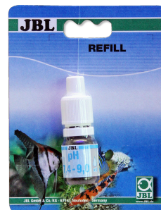
Test JBL pH 7,4-9,0 Test de pH para acuarios y estanques entre 7,4-9,0