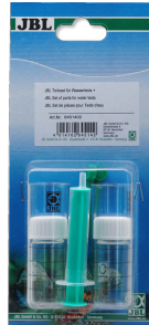
JBL Set de piezas de test para el agua