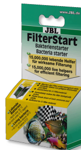
JBL FilterStart Bacterias para activar filtros