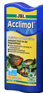
JBL Acclimol Acondicionador para la aclimatación de peces nuevos