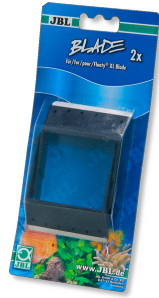
JBL BLADE para FLOATY L/XL Cuchillas de recambio para Floaty Blade