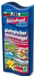
JBL BactoPond Bacterias para la autolimpieza del estanque