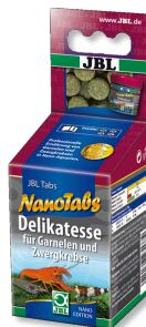
JBL NanoTabs Alimento básico para camarones y acociles