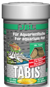
JBL Tabis Pastillas especiales para peces de agua dulce y salada