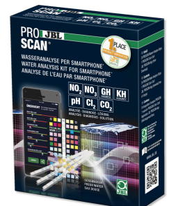
JBL PROSCAN Test para el agua con evaluación por smartphone