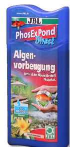
JBL PhosEx Pond Direct Eliminador de fosfatos para el estanque