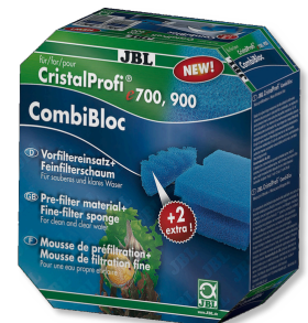
JBL CombiBloc CristalProfi e

Espuma de poro fino para el filtro CristalProfi